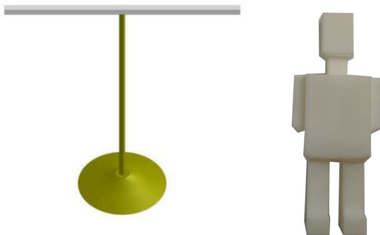
图 6 高空平台及人形救援对象示意图

料材质，高度约为 60mm，重量为 5（±0.5）g，初中组数量 2 个，如图 6 所示。