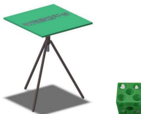
图 3 物流平台及运送物品示意图

物流平台长宽约 400mm，高度约 800—1000mm。从物流基地区域抽取 1 个小正方形摆放物流平台，平台垂直投影与所在小正方形边线对齐。物流平台形式和材料不限，如图 3 所示。