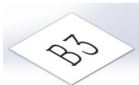
图 5 坐标点及摆放示意图

随机从字母（A、B、I、J）和数字（0-9）中各抽取 1 个组合成坐标点，坐标点在飞行机器人起飞后居中摆放于从空中侦测区域抽取的 1 个小正方形中，坐标点样式为字母和数字组合，单个字母或数字所在纸张大小 150mm × 150mm，字体采用黑体，字号为 300，文字居中，如图 5 所示。材质、大小、样式等以现场提供为准。