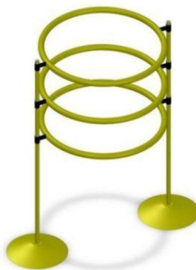
图 4 隧道示意图